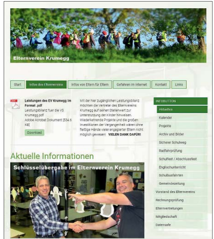
Screenshot der Internetseite des Elternvereins Krumegg www.eltern-krumegg.at