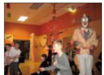
Faschingsfest mit Kindergarten und Volksschule Krumegg

„Das Ganze ist mehr als die Summe seiner Teile“ (Aristoteles)