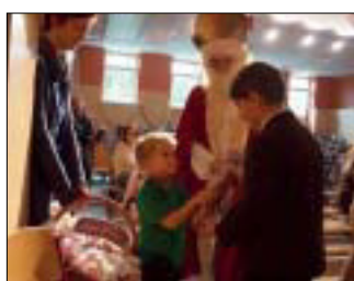
Der Nikolaus zu Besuch